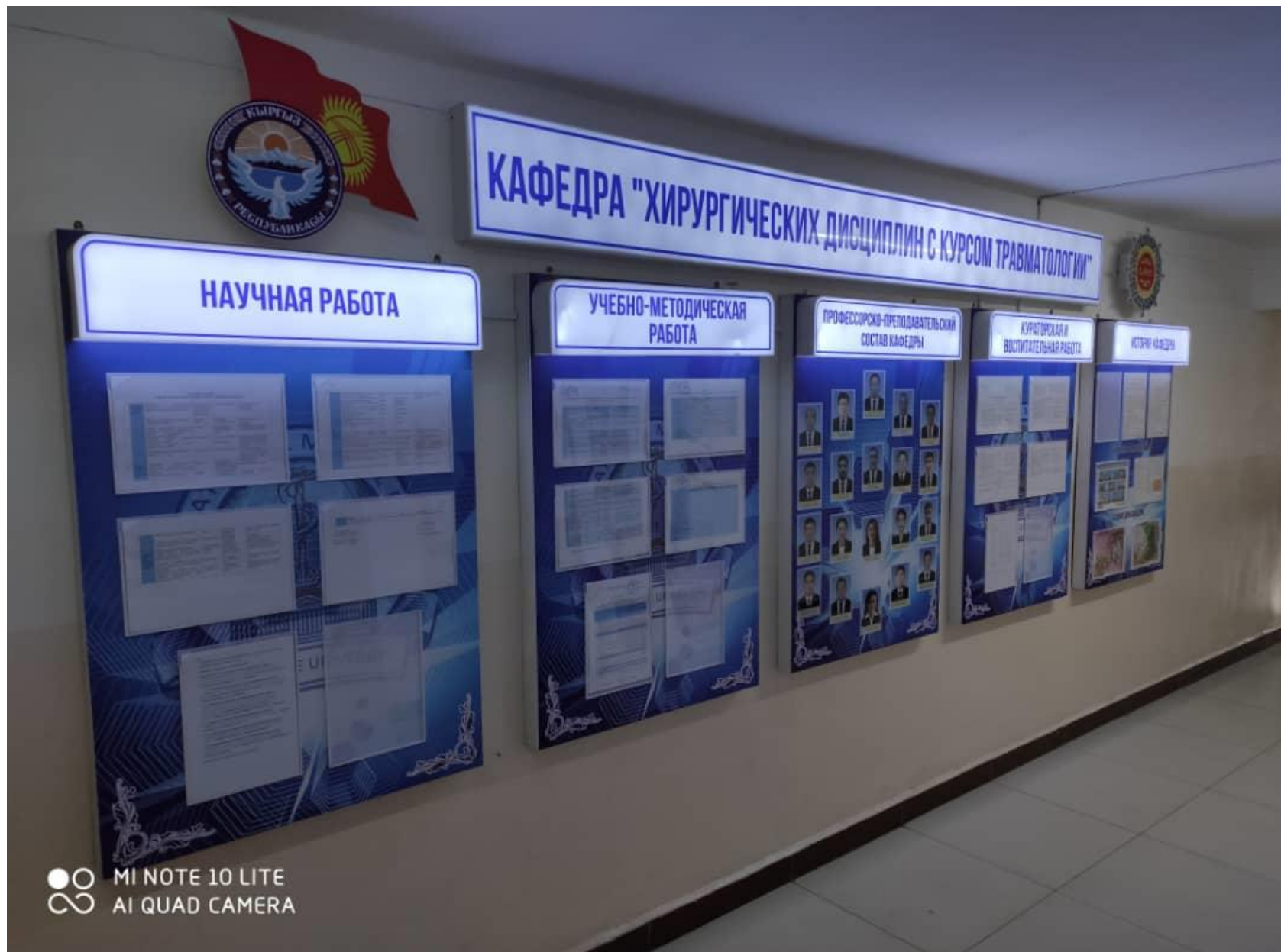
Приложение 7.1. Аудиторный фонд кафедры