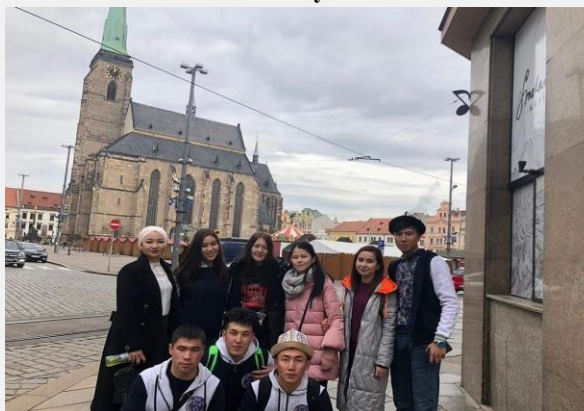
Студенты ФМО в Германии