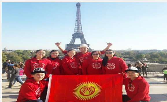
Студенты программы «международные отношения» во Франции

По окончании данной образовательной программы присваивается академическая степень «Бакалавр в области международных отношений».