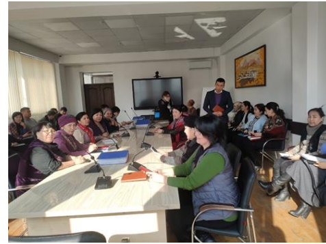
Долбоордун алкагында окутуучулардын билимин өркүндөтүү багытында “Окутуудагы компетенттүүлүк мамилени ишке ашыруунун технологиялары жана ыкмалары” проблемасы боюна семинар-тренинг болуп өттү (2021-ж. 21-22-май, Тренер Жусупова А.).