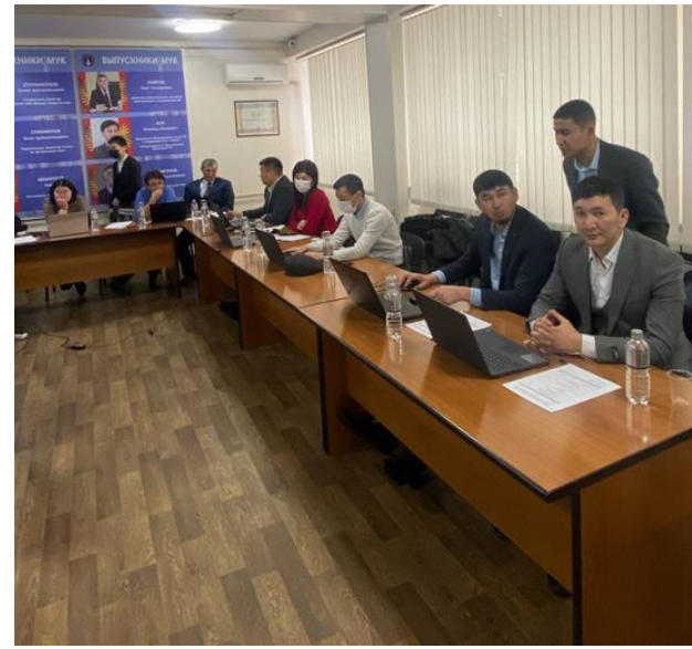
Повтас адистигинде сабак берген окутуучулардын кесиптик билимин өркүндөтүү боюнча ИПКнын окутуучулары Бишкек шаарында курстан өтүүдө (февраль, 2022).