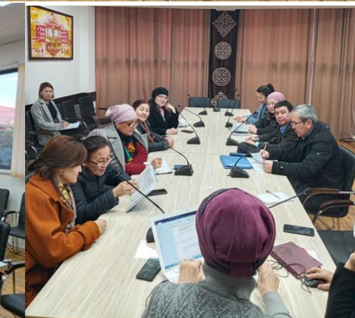
2020-2021-окуу жылында ноябрь айында “Орто кесиптик билим берүү тармагында окутуучу” программасы боюнча окутуучуларды кайра даярдоо курсу уюштурулуп, ийгиликтүү аяктады (1- группа).