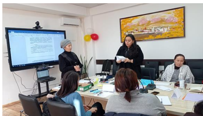
2021-2022-окуу жылында ноябрь айында “Орто кесиптик билим берүү тармагында окутуучу” программасы боюнча окутуучуларды кайра даярдоо курсу улантылды (2-группа).