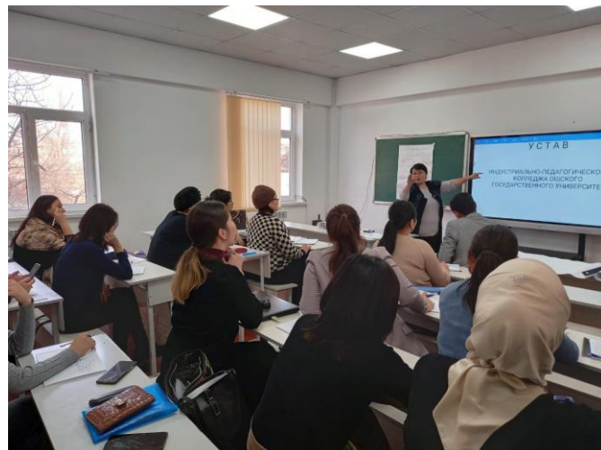
2022-ж. февраль айында “Орто кесиптик билим берүү тармагында окутуучу” программасы боюнча окутуучуларды кайра даярдоо курсу улантылды (3-группа).