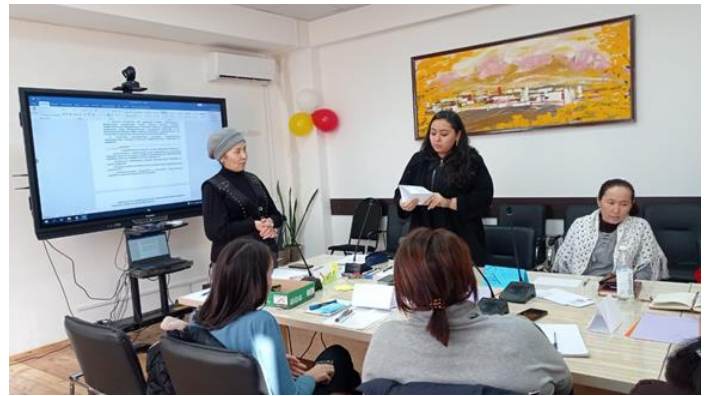
2021-2022-окуу жылында ноябрь айында “Орто кесиптик билим берүү тармагында окутуучу” программасы боюнча окутуучуларды кайра даярдоо курсу улантылды (2-группа).