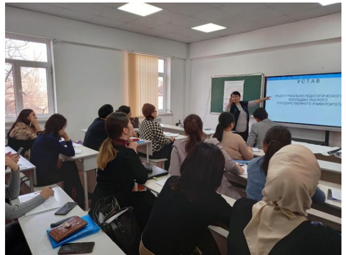
2022-ж. февраль айында “Орто кесиптик билим берүү тармагында окутуучу” программасы боюнча окутуучуларды кайра даярдоо курсу улантылды (3-группа).