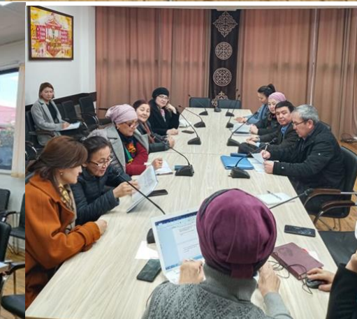
2020-2021-окуу жылында ноябрь айында “Орто кесиптик билим берүү тармагында окутуучу” программасы боюнча окутуучуларды кайра даярдоо курсу уюштурулуп, ийгиликтүү аяктады (1- группа).