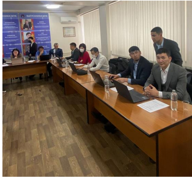
Повтас адистигинде сабак берген окутуучулардын кесиптик билимин өркүндөтүү боюнча ИПКнын окутуучулары Бишкек шаарында курстан өтүүдө (февраль, 2022).