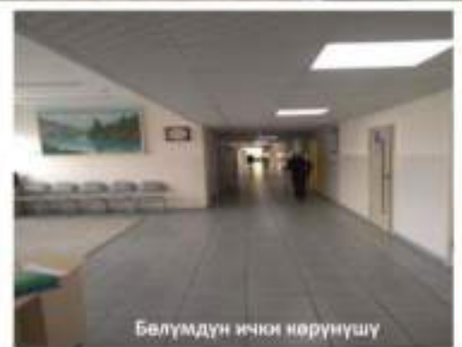
Бөлүмдүн ички көрүнүшү