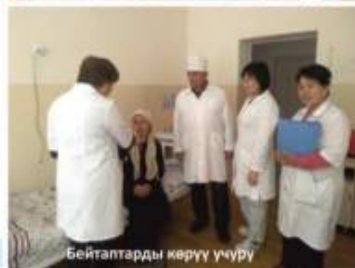
Бейтаптарды көрүү учуру