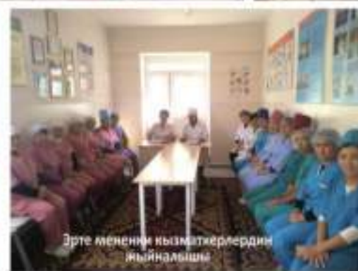
Эрте мененки кызматкерлердин жыйналышы