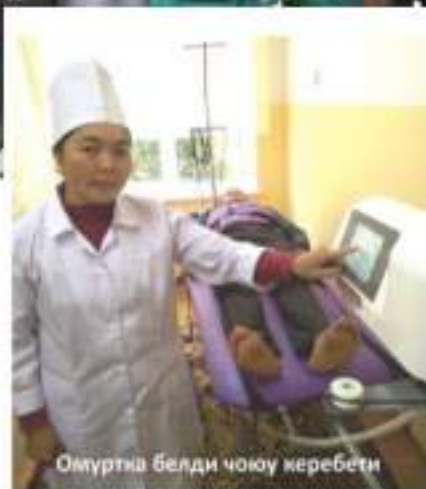
Омуртка белди чоюу керекети