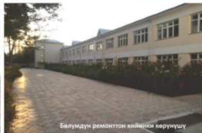
Бөлүмдүн ремонттон кийинки көрүнүшү