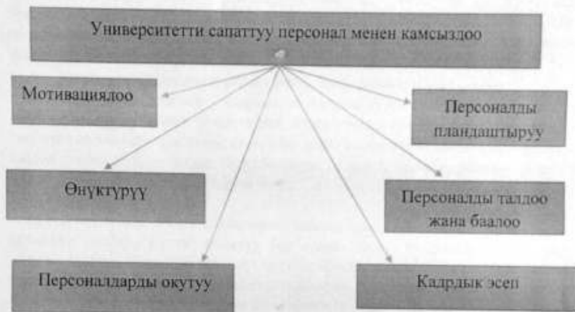
2-сүрөт. Персоналды башкаруу

Кадрларды башкаруу процессине пландаштыруу, мотивация, өркүндөттүү, окутуу, талдоо жана персоналды баалоо боюнча көптөгөн милдеттер камтылган.