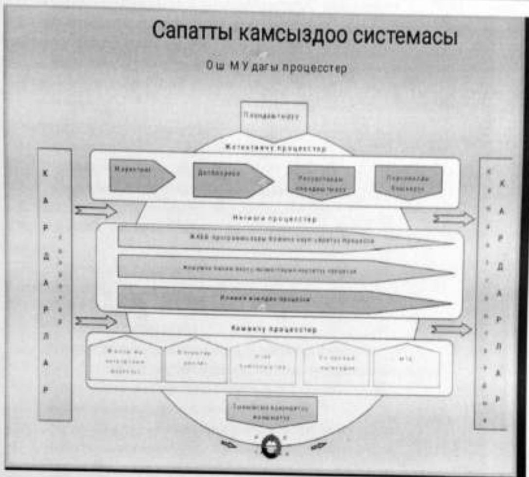
2-сүрөт. ОшМУдагы процесстер

Процесстерде ЖОЖ өз ресурстарын пайдалануу менен кызыкдар тараптардын кирүүдөгү талаптарын Демингдин цикли (РДСА) боюнча чыгуудагы натыйжага өзгөртүп түзөт (мында Р-пландаштыруу, Д-иштөө, С-текшерүү, А-аткаруу). Бул өзгөртүп түзүү билим берүү процессинде жана ЖОЖдун ресурстарынын катышуусунда жүрөт.