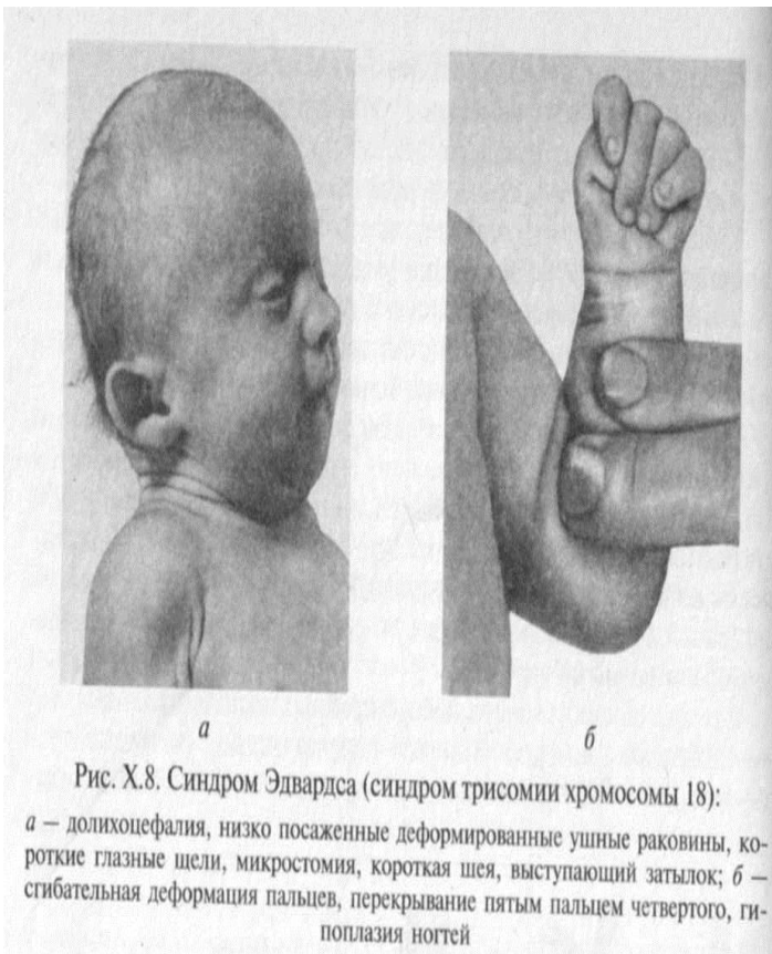
Рис. X.8. Синдром Эдвардса (синдром трисомии хромосомы 18): а — долихоцефалия, низко посаженные деформированные ушные раковины, короткие глазные щели, микростомия, короткая шея, выступающий затылок; б — сгибательная деформация пальцев, перекрывание пятым пальцем четвертого, гипоплазия ногтей

203. На снимке изображен пациент с синдромом трисомии хромосомы XVIII, с характерными чертами (долихоцефалия, низко посаженные ушные раковины, сгибательная деформация пальцев, перекрыванием пятого пальца четвертым). Ваш предварительный диагноз?