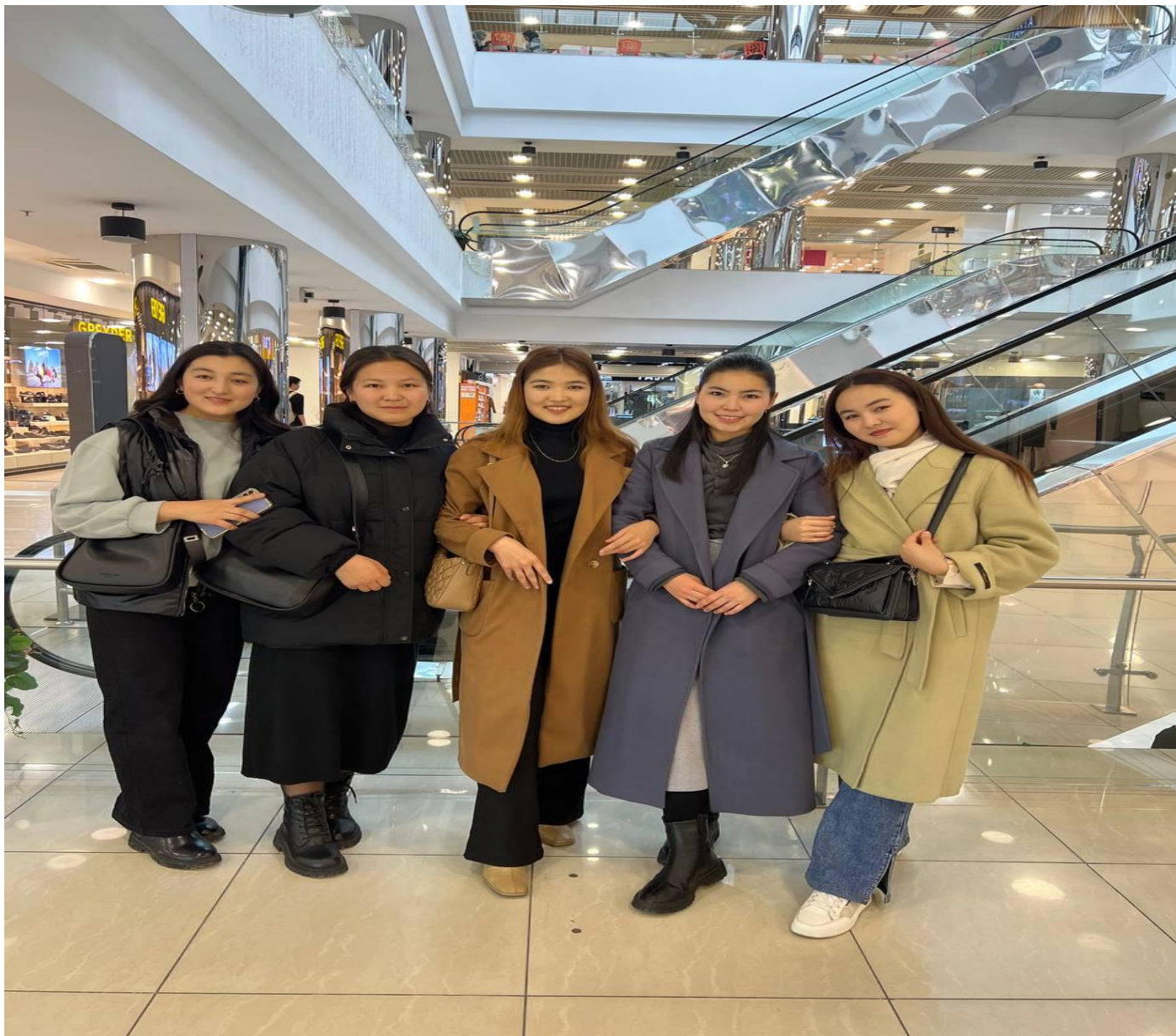
В ТашГУ им.Низами