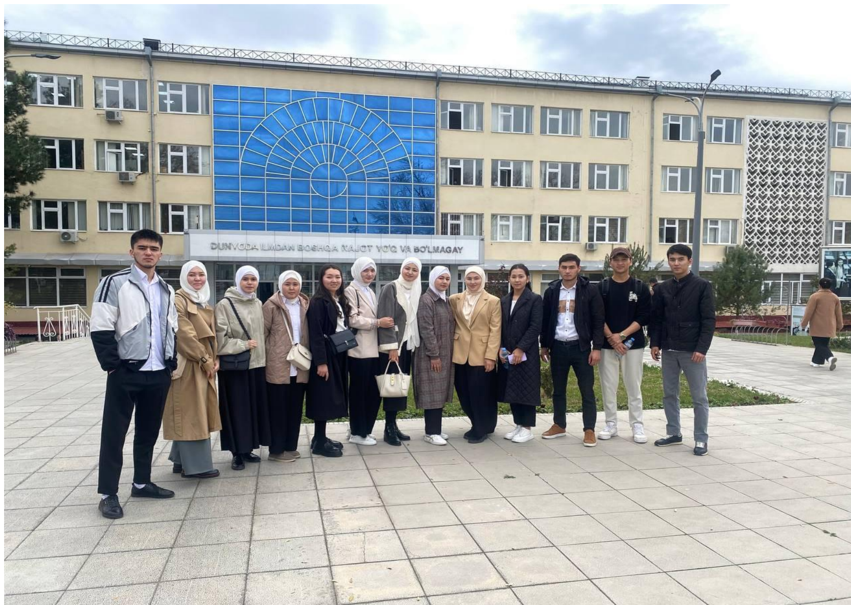
Наши студентки в Ташкентском государственном университете им. Низами