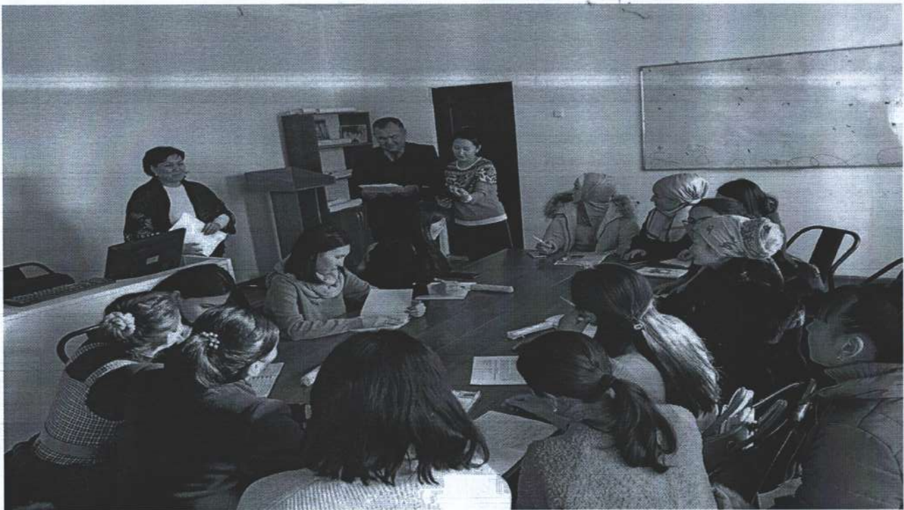
Магистранттар менен жоолугушуу. Магистранттарга магистратура жана бакалавр программасындагы айырмачылыктар жөнүндө түшүндүрүү иштерин программа жетекчилери биргеликте жүгүзүүдө.