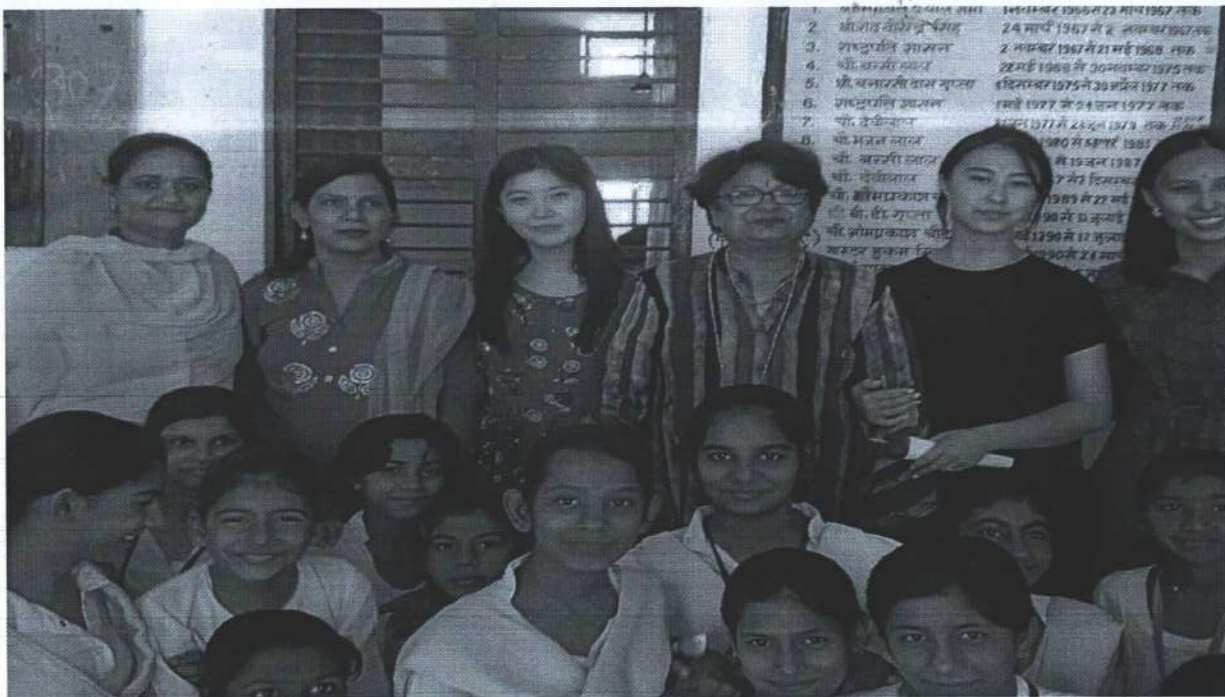
Академиялык мобилдүүлүк боюнча окутуучулар жана магистранттар Индия мамлекетинин Харианна штатында