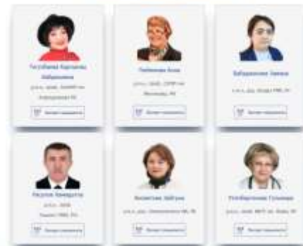
Список о зарубежных руководителях

Это международное партнерство способствует обмену знаниями, совместным исследовательским проектам и публикациям в рецензируемых журналах.