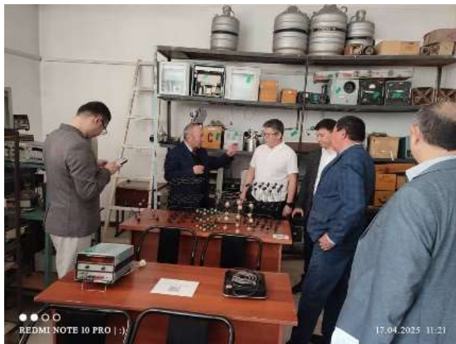
Илимий окуу борбору (211-ауд)