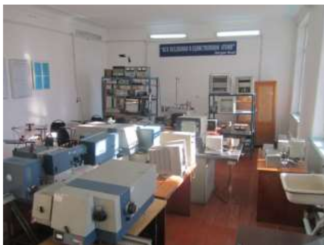
Катуу телолордун физикасы лабораториясы (212-ауд.)