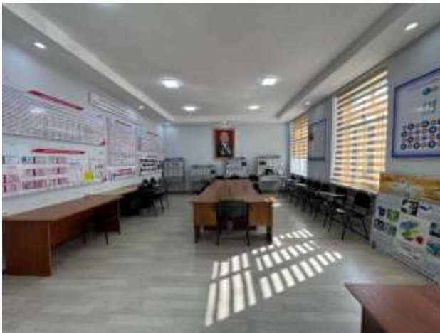
Проф.Б.Арапов атындагы лекциялык каана (210-ауд)