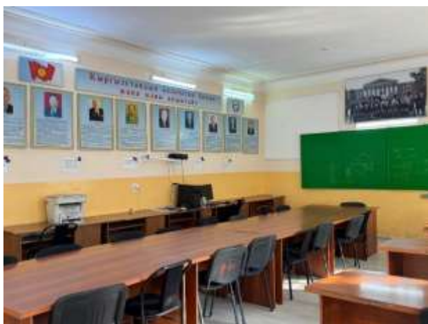
Мультимедиялык лекциялык каана (209-ауд)