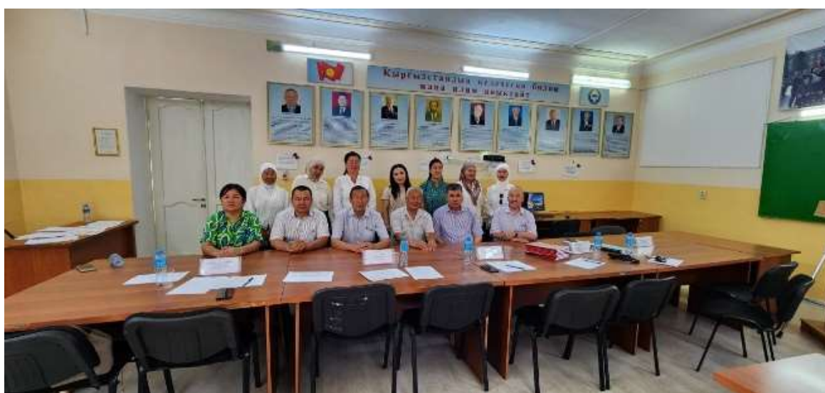
Квалификациялык жумуштарды коргоодон кийинки учур