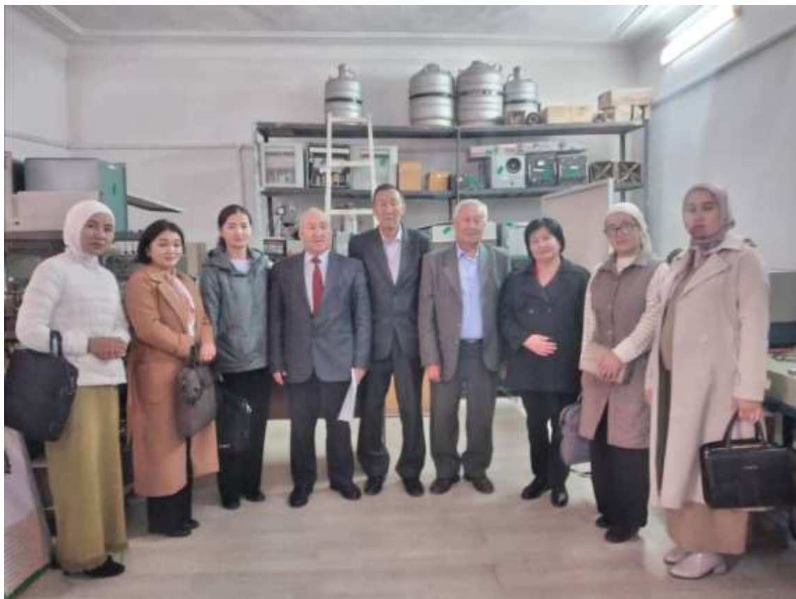
2026-жылы магистратураны аяктоочу магистрлер

2014-жылы тартып кафедрада 510400 - “Физика” багытында магистратура ачылды. Бул багытка тапшырган магистрлер өздөрүнүн илимий жетекчилеринин жардамы менен бир топ илимий статьяларды республикалык жана чет элдик басылмаларда жарыялашып, көптөгөн илимий семинар жана конференцияларда докладдарды жасашты.