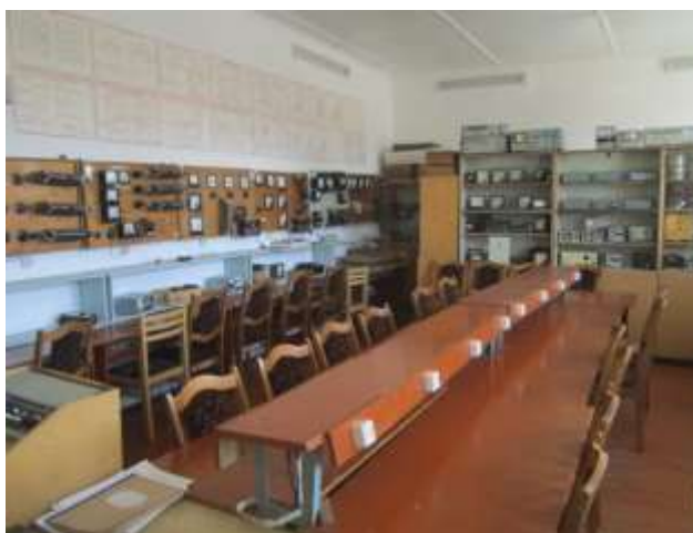
Электротехника, электроника жана контролдук өлчөөчү приборлор лабораториясы (206-ауд.)

Ф.Н.Зайтов жана Ю.Л.Луканцев атындагы кафедралар аралык окуу-илимий борборунда кафедранын окумуштууларынын жетекчилигинде студенттер, магистранттар жана PhD докторанттар квалификациялык жана докторлук диссертацияларын аткарышат. Кафедрага тиешелүү магистрлер менен PhD докторанттар конденсацияланган заттардын физикасы багытында өндүрүштүк, илим изилдөө жана илимий-педагогикалык практикаларын да кафедралар аралык илимий борбордон өтүшөт.