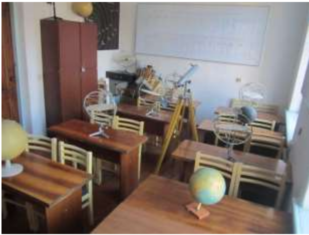
Астрономия жана астрофизика лабораториясы (215-ауд)