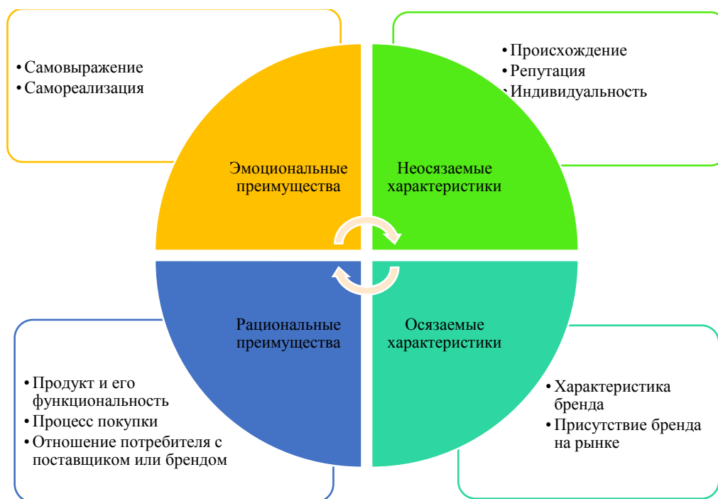
Рис. 2.2. – Структура восприятий бренда