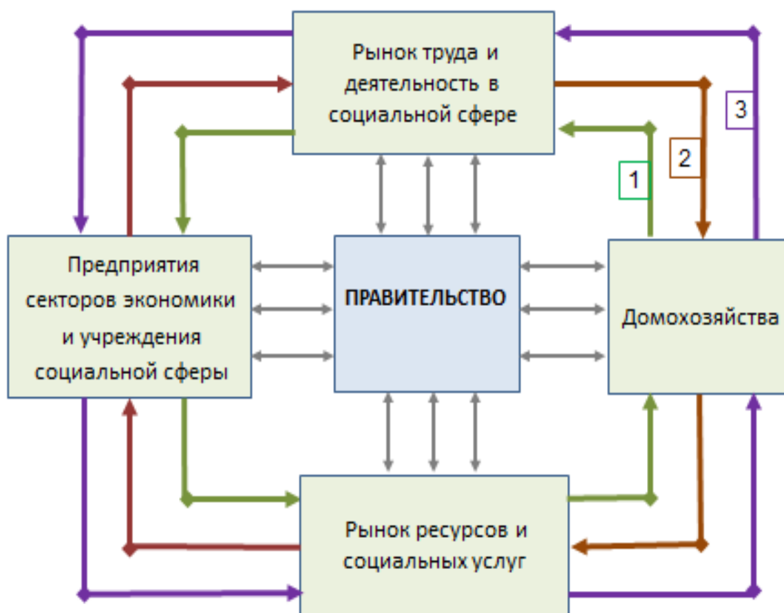
Рис. 1.1. Кругооборот доходов ресурсов и социальных услуг Источник: составлен автором.

Тем не менее можно обозначить некоторые направления социальной сферы, которые в той или иной степени оказывают влияние на экономику. Общая схема такого влияния может быть представлена через кругооборот доходов, ресурсов и социальных услуг (рис. 1.1).