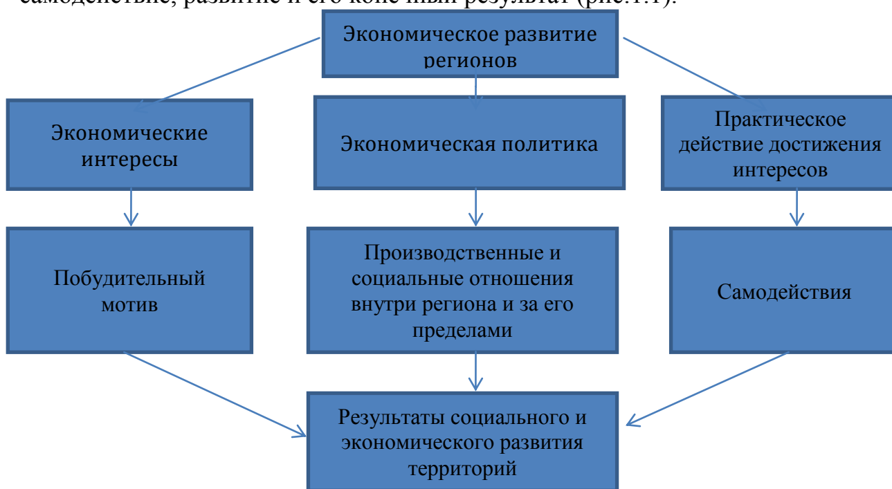
Рис. 1.1. Взаимодействие трех направлений экономического развития регионов.

При этом основной целью обеспечения эффективного использования потенциалов регионов Кыргызстана, является реализация национальных интересов через формирование материальной основы успешного развития каждого села, района и города, всех областей республики. В этом контексте «экономические интересы – экономическая политика – практические действия для достижения интересов» выступают как три стороны экономического развития регионов, включающие побудительный мотив, самодействие, развитие и его конечный результат (рис. 1.1).