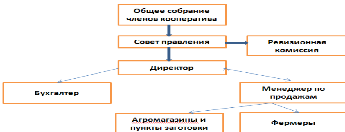
Рис. 2.1. - Организационная структура СХК «Золото долины»

Как видно из рисунка, в структуре управления прослеживается трехзвенное управление, согласно которому нижним звеном являются агромагазины и пункты заготовки сельхозпродукции в Араванском и Карасуйском районах, подчиняющиеся отделу продаж, который представляет собой среднее звено и в свою очередь подчиняется директору кооператива. Высшим органом управления является общее собрание членов кооператива, которое проводится по мере необходимости, но не реже двух раз в год.