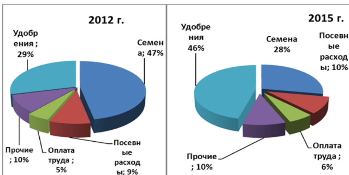
а) Затраты на производство яблок