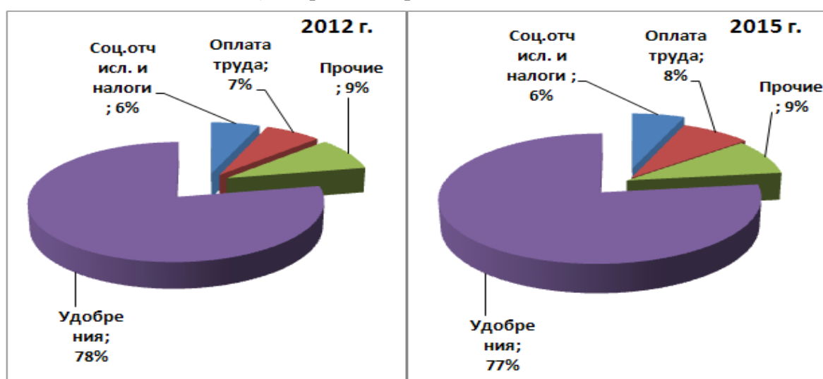
б) Затраты на производство риса